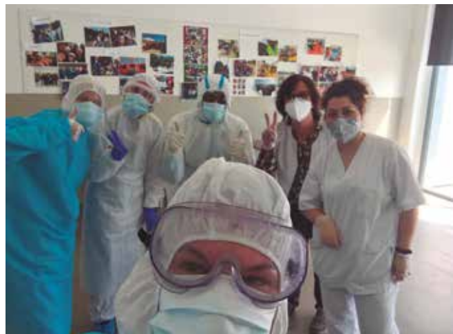
Tests massius amb Open Arms

Es dona un sol cas positiu que es manté asimptomàtic, en una persona atesa al centre Aral.