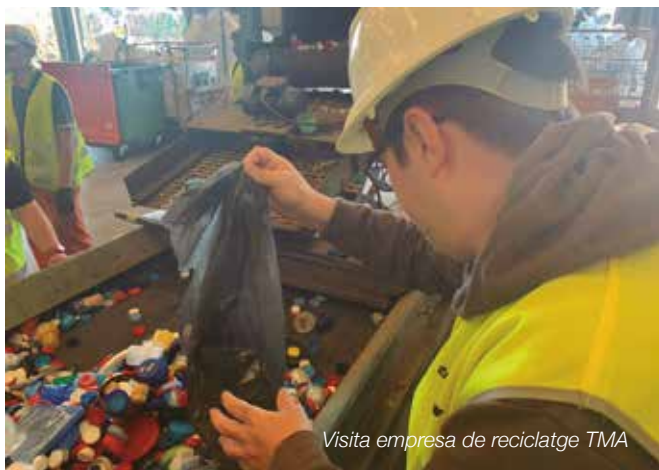
Visita empresa de reciclatge TMA

Ajuntament de Barcelona, Banc Sabadell (Seu Centra), BBVA (oficines de C/ Gràcia, Tres Creus, Pl. Creu Alta, Via Massagué, Ctra. de Prats, República i Taulí); Biblioteques Municipals (Nord, Sud, Ponent, Vapor Badia, La Serra, Safareigs i Can Puiggener); Centres d'ATENDIS: (La Carena, Casal Can Rull, Llar-Residència Jacquard i SIL Taina); Centres Cívic Creu de Barberà; Club Tennis Sabadell; Complexos Municipals Gent Gran (Sant Oleguer, Alexandra, Parc Central i Mercat de Sant Joan); Escola Cervetó de Granollers; Escola Marta Mata de Barberà del Vallès, Escola Monbou d'Igualada; Escoles Públiques Enric Casassas, Miquel Martí i Pol i Calvet d'Estrella; EUNCET Bussines School; FALK VL; Fruiteria “La teva fruiteria”; Institut Sabadell; ITEC; RUNDI; i Transports Urbans de Sabadell (TUS).