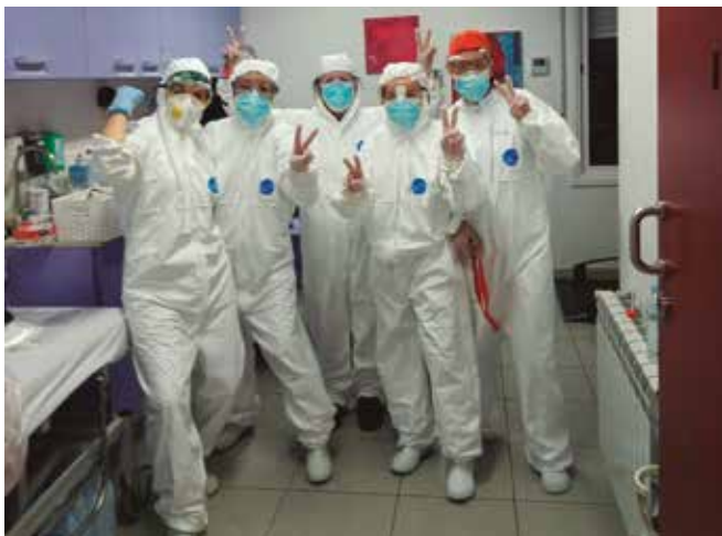
Professionals Casal Can Rull amb Equips de Protecció Individuals (EPI)

Intensificació i denúncia visible als mitjans de comunicació nacionals (RAC 1 i TV3) i locals posant de manifest la necessitat urgent de material de protecció tant a ATENDIS com del sector en general. En paral·lel, gestió molt intensa liderada per Junta i Patronat de l'entitat i de crida URGENT per aconseguir Material de Seguretat i Protecció. Impressionant resposta de donació de material (d'higiene, sanitari, de protecció, de seguretat) i gran xarxa de persones que han confeccionat material (mascaretes, gorros, mascaretes amb impressió 3D, pantalles protectores, etc.).