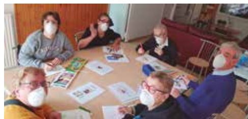
Taller de Mandales Llar-Residència Jacquard