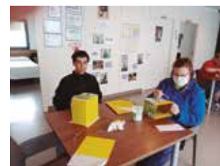
Taller de Manualitats Centre Aral