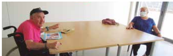
Visita al centre Bauma

Coincidint amb l'entrada a la Fase II del Pla de desescalada, s'inicien les visites de familiars/tutors als centres residencials amb cita prèvia i amb les mesures de seguretat i protecció establertes.