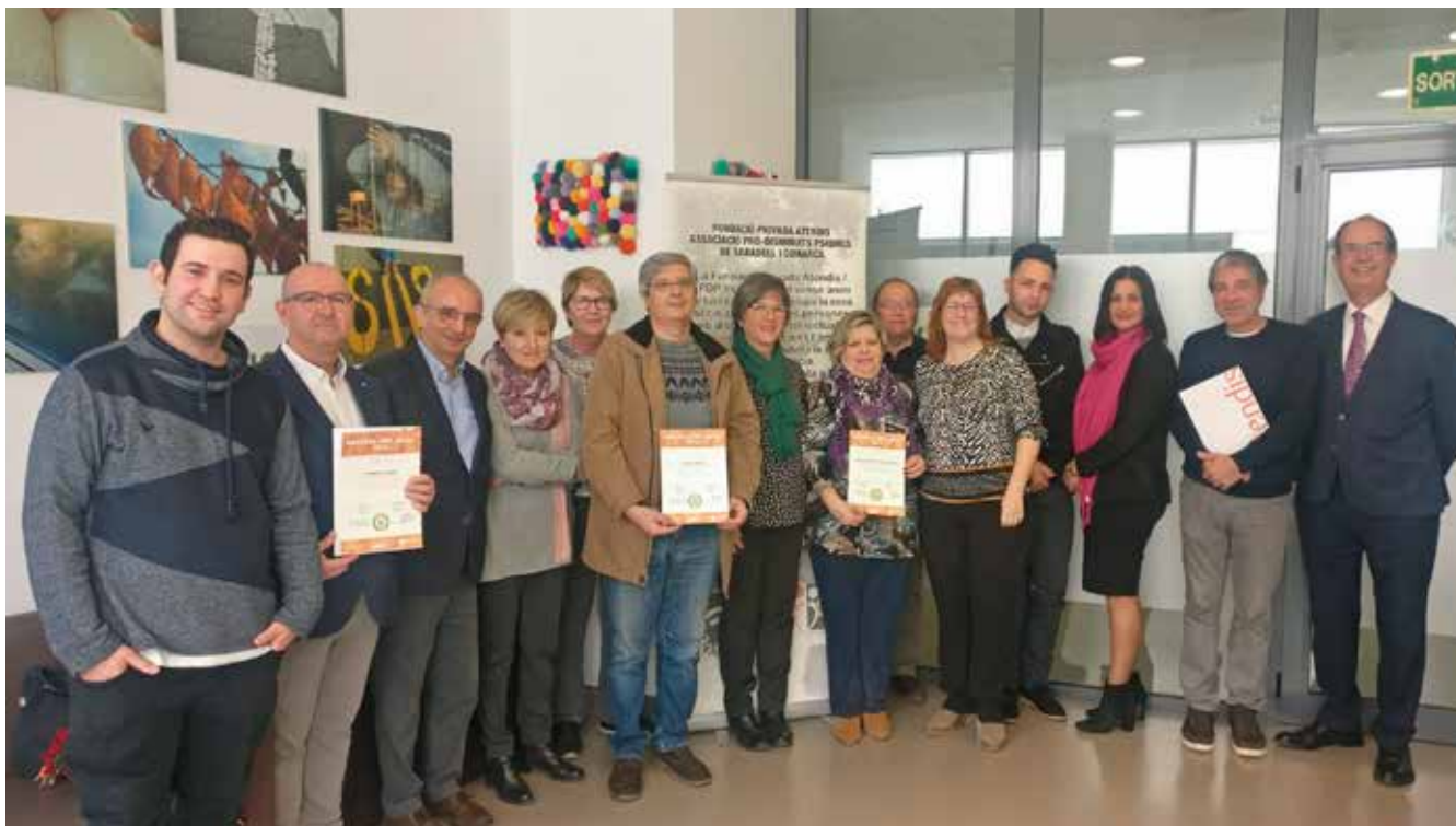
Entrega de diplomes a les empreses col·laboradores

Amb tot, sense deixar de mencionar les més de 200 empreses que cada any ens donen recolzament directa o indirectament.