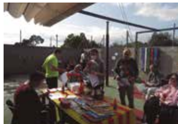
Celebració de la Diada de Sant Jordi