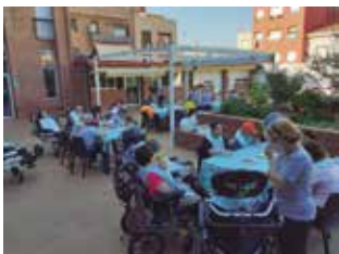
Celebració de la Diada de Sant Joan