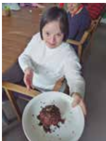
Celebració del Dia de la Mona

Tot seguit podreu veure com i amb què hem aprofitat el temps!