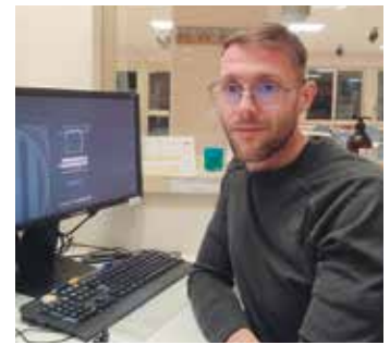
SIL Taina Acompanyament 5 persones per superar les oposicions