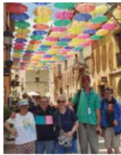
Residència Jaquard Excursió al Poble Espanyol