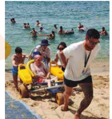
Casal Can Rull A la platja