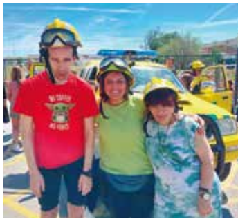
Centre Aral Visita dels Bombers