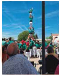
Centre Bauma Festa Major Bauma