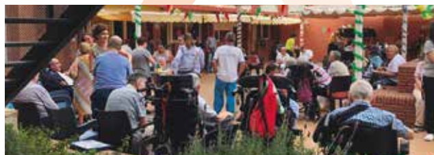
Casal Can Rull Festa de Primavera