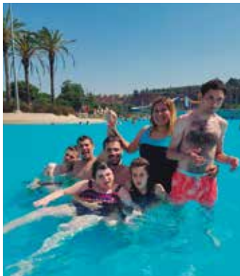
Centre l'Aplec Sortida a La Bassa