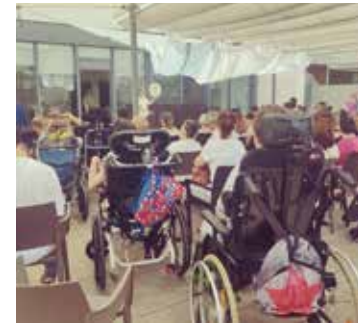
Centre l'Aplec Festa d'estiu