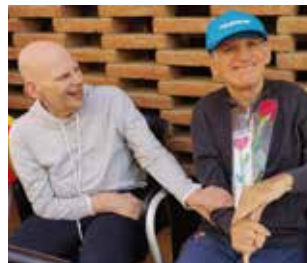
Casal Can Rull Parada de Sant Jordi