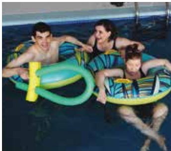
Centre Bauma Gaudint de la piscina