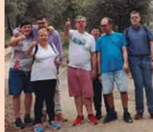
Centre Aral Escapada al Rodal