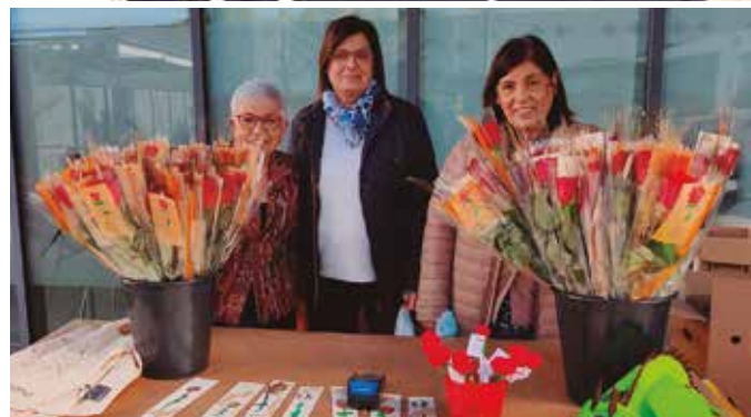
Parada de Sant Jordi - La Carena