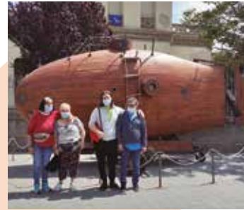
Llar-Residència Jacquard Festa Major Cerdanyola del Vallès