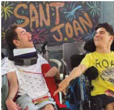
Centre l'Aplec Revetlla Sant Joan