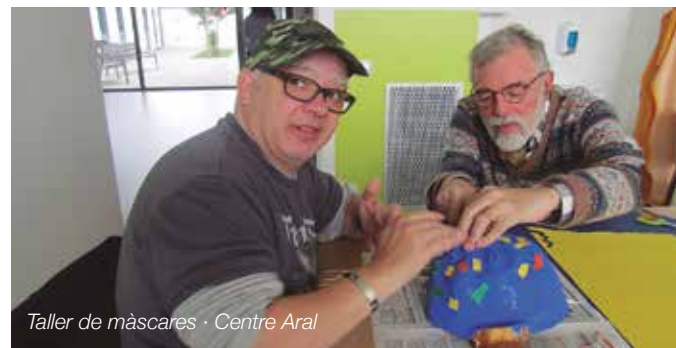
Taller de màscares · Centre Aral

A Atendis vaig trobar persones que em recordaven els tallers que gairebé havia oblidat! A l'hospital tot i que no treballava directament tinc un retorn fantàstic que fa que m'emocioni sovint.