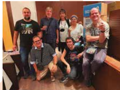
SIL Tania Participació 25 anys ACTAS