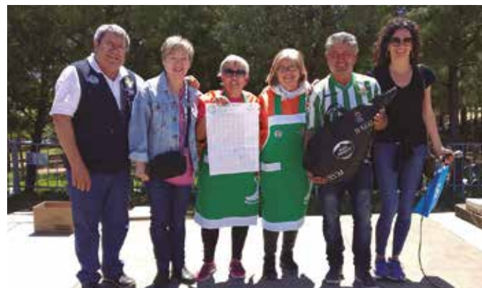
Atendis Gresca Col·laboració amb la Peña Eurobética

És importantíssim. No és senzill organitzar i dur a terme tots els actes que realitzem i que a més, surtin bé i que tinguem el nivell de participació desitjada.