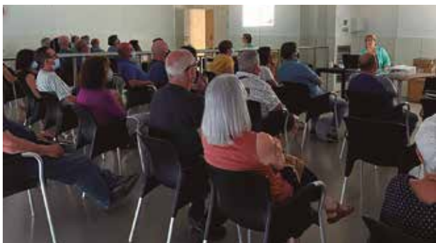
Familiars i tutors a la xerrada a La Carena

Més de 50 persones entre professionals i famílies/tutors hi han participat, posant èmfasis a la positivitats de les trobades on es va oferir informació d'interès i rellevant relacionada amb el funcionament i les activitats de l'entitat i dels centres.