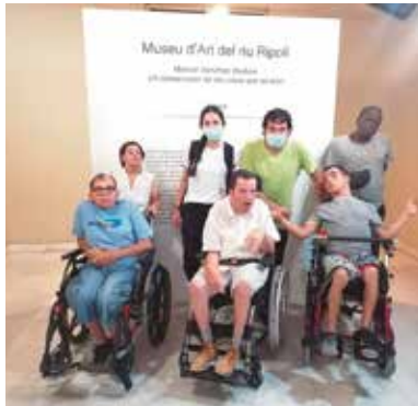
Centre l'Aplec Museu d'art Sabadell