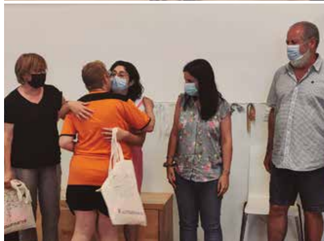
Entrega dels obsequis per part de persones ateses