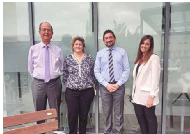
Responsables de l'oficina de Caixabank de la Plaça Enric Granados

Representants de CAIXABANK ens van acompanyar a la visita a les instal·lacions de La Carena de la mà del nostre president i la gerent.