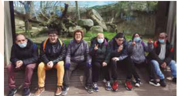
Centre Aral Sortida al Zoo de Barcelona