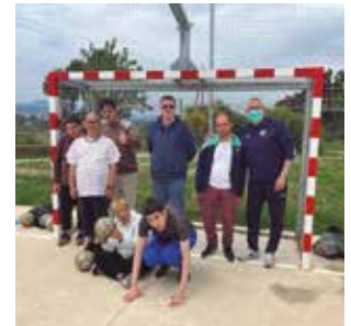
Centre Aral Fútbol Inclusiu