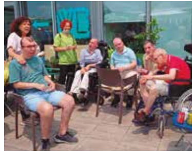
Centre Casal Can Rull Arrossada a La Carena