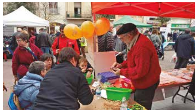
Taller Bombes de llavors · Jornada Som Capaços