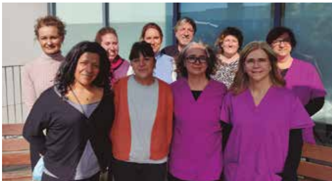
Membres del Comitè Directiu

La celebració del Dia Internacional de la Dona és important per a reivindicar la igualtat de drets i oportunitats de les dones i a Atendis ho tenim ben present. Al capdavant del Comitè de Direcció de l'entitat hi ha una clara majoria de dones que dia a dia impulsen i treballen amb i per les persones ateses als nostres centres.