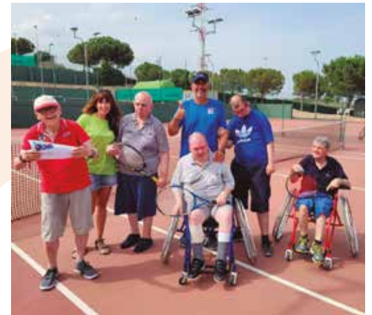
Centre Casal Can Rull Fi de curs Tennis · Cercle Sabadellès