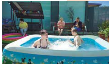
Centre Bauma · Jocs d'estiu